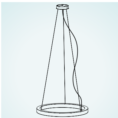
ABHÄNGUNG: 1 SUSPENSION: 1 SUSPENSION: 1