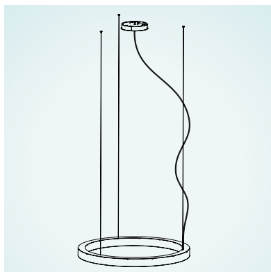
ABHÄNGUNG: 2 SUSPENSION: 2 SUSPENSION: 2