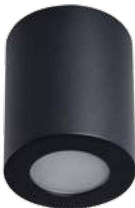
SANI IP44 DSO-B