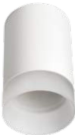
LUNATI GU10 W