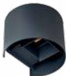
REKA LED EL 7W-O-GR