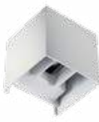
REKA LED EL 7W-L-W