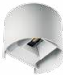
REKA LED EL 7W-O-W