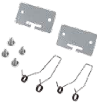
ZESTAW MONT. P/T iTECH

Oświetlenie awaryjne lub antypaniczne stosuje się w pomieszczeniach typu Open Space, aby przeciwdziałać panice. Pozwala na dotarcie do miejsca, w którym widać oznaczoną drogę ewakuacji jak i oznaczenie samej drogi ewakuacyjnej zależnie od przyzmy zastosowanej w oprawie. 25438 - Zestaw montażowy podtynkowy P/T iTECH.