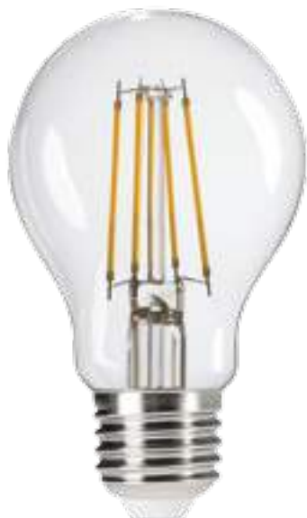
XLED A60 4,5W