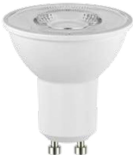
TEZI LED3,5W GU10