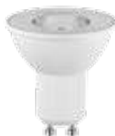
TEZI LED4,5W GU10