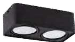
TUBE0 ES 250-B