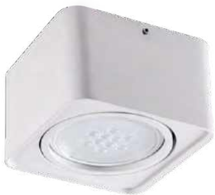
TUBE0 ES 50-W