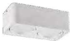
TUBE0 ES 250-W