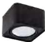
TUBE0 ES 50-B