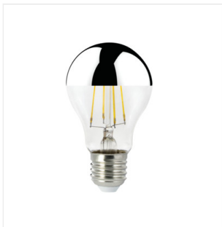
XLED A60 M 7W