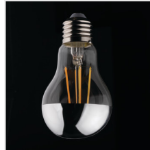
XLED A60 M 7W-WW