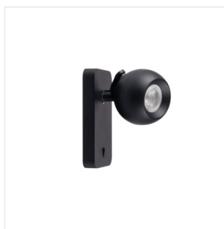
GALOBA W 1xGU10 B