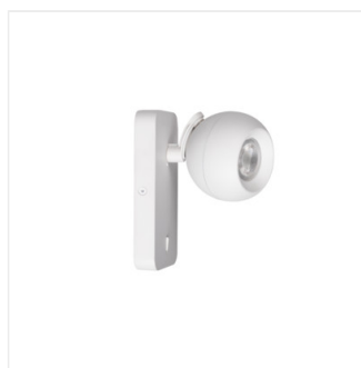
GALOBA W 1xGU10 W