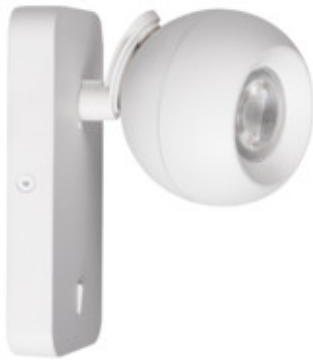
GALOBA W 1xGU10 W