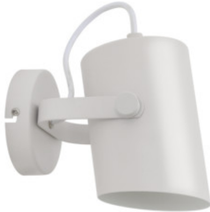
LARATA EL-10 W