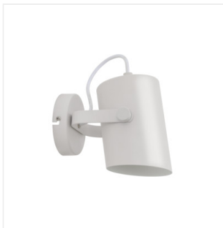
LARATA EL-10 W