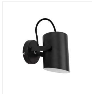
LARATA EL-10 B