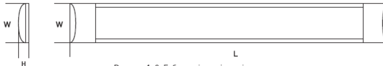
Рисунок 1. 2. Габаритні розміри світильника