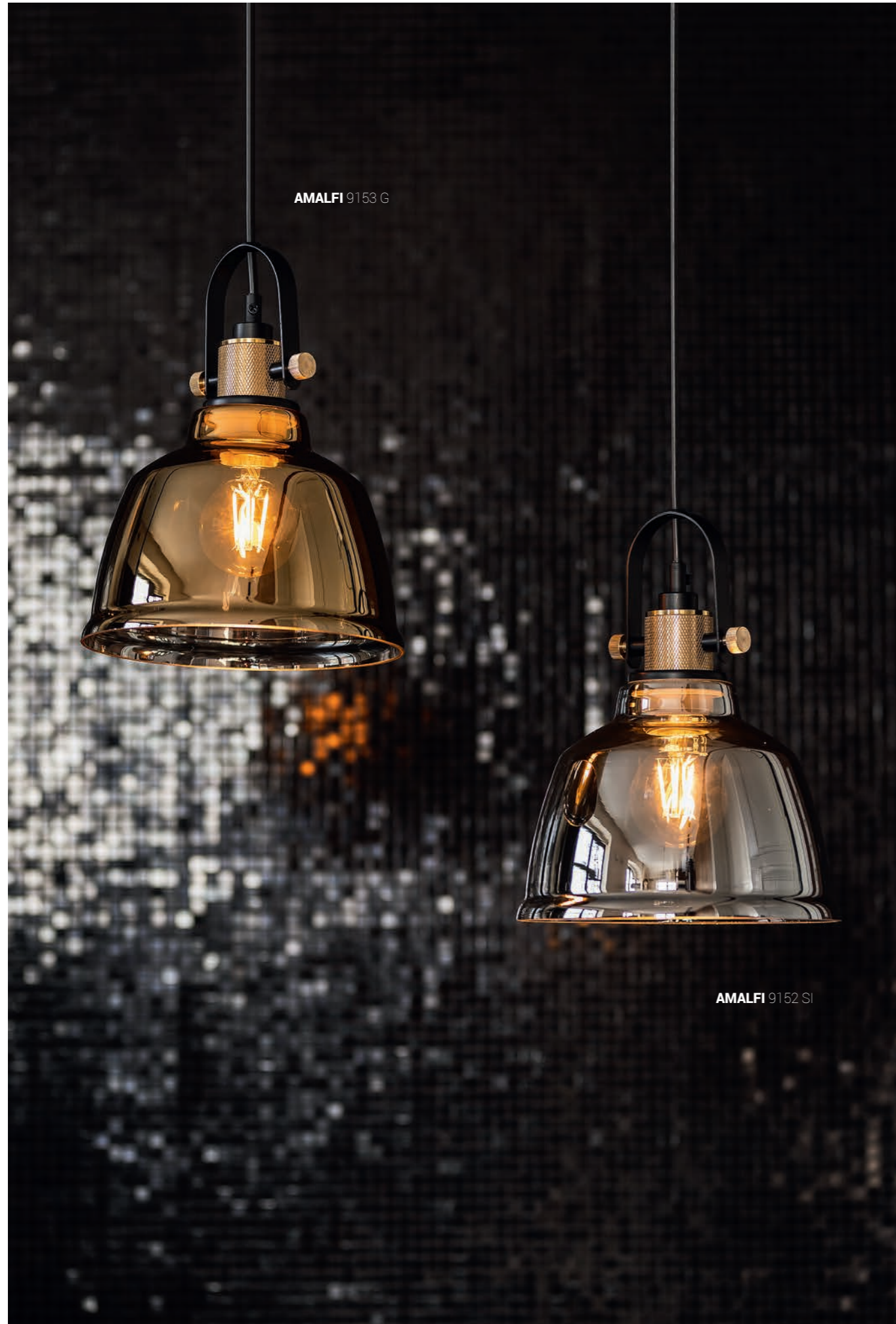
AMALFI 9153 G