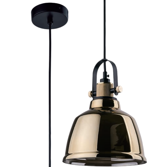
AMALFI 9153 G