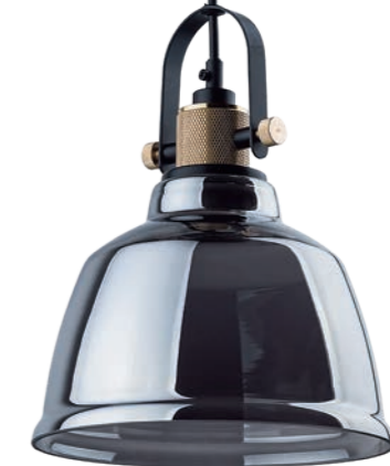
AMALFI 9152 SI