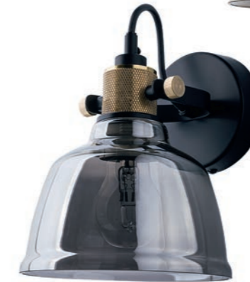
AMALFI 9154 SI