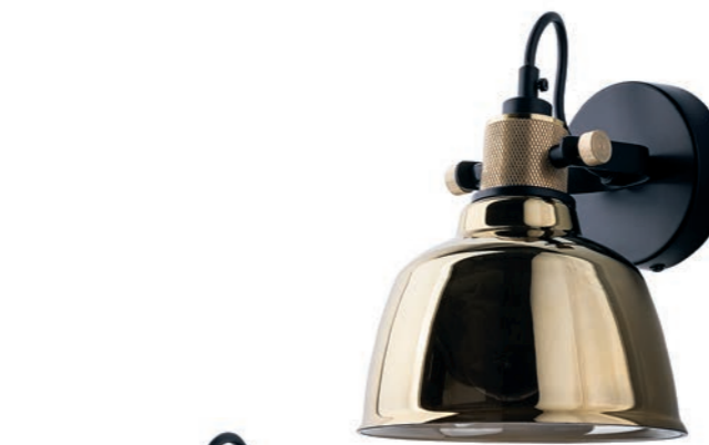
AMALFI 9155 G