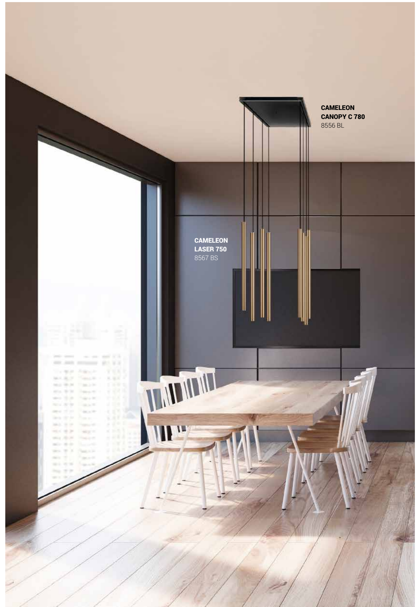
CAMELEON LASER 750 8567 BS