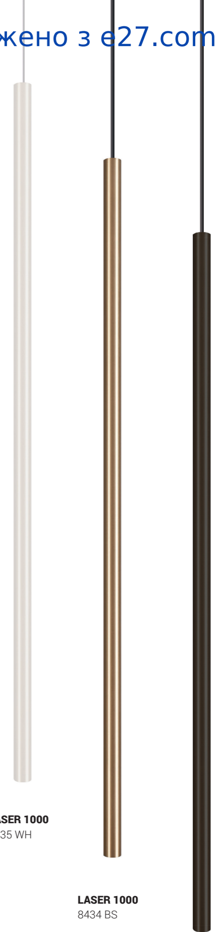
LASER 1000 8435 WH