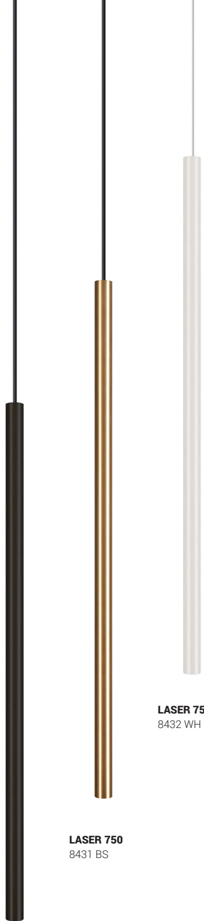
LASER 750 8432 WH