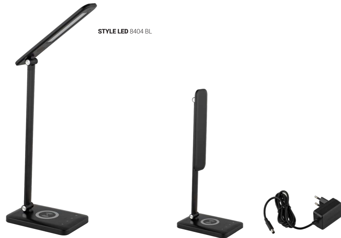
STYLE LED 8404 BL