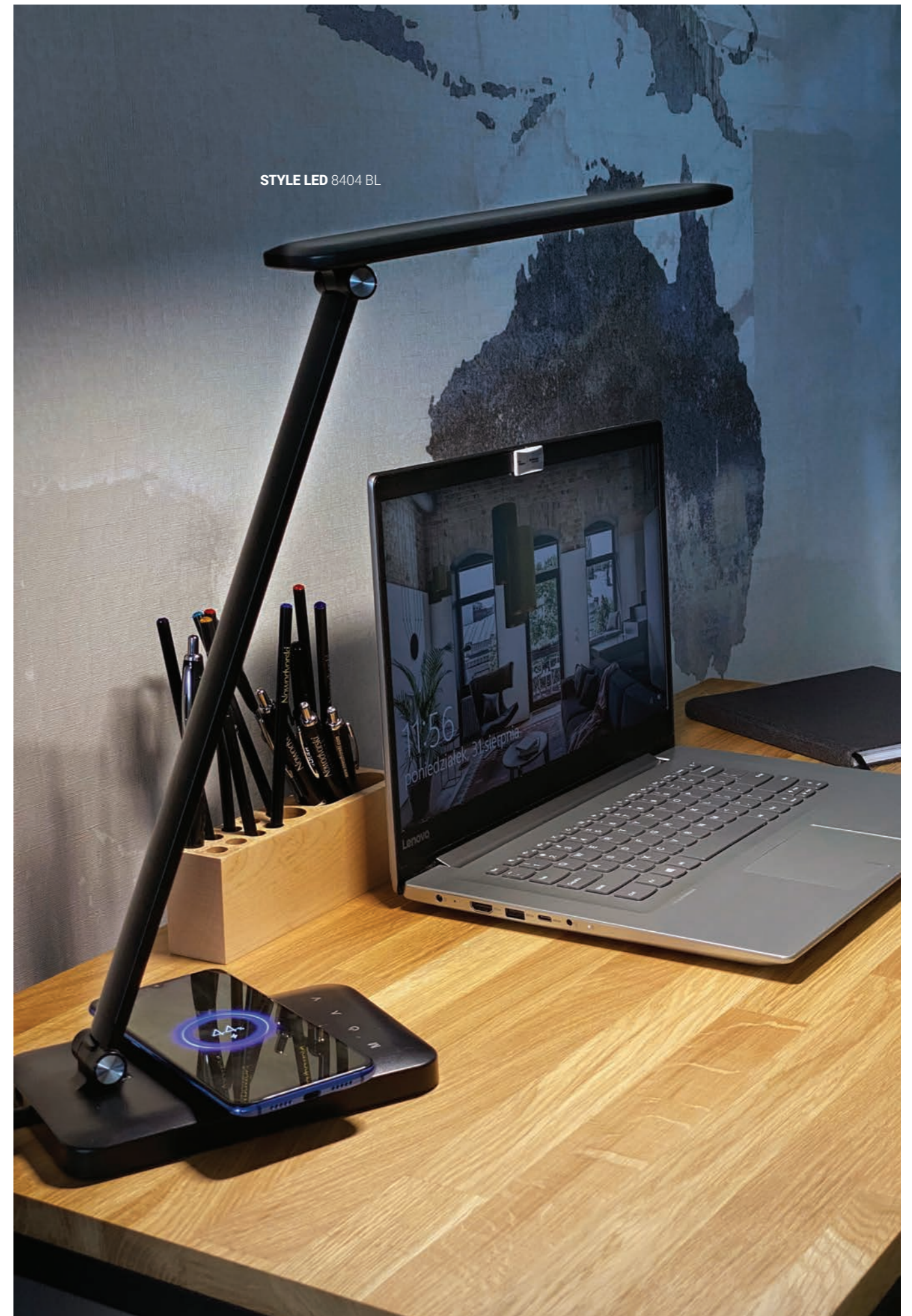
STYLE LED 8404 BL