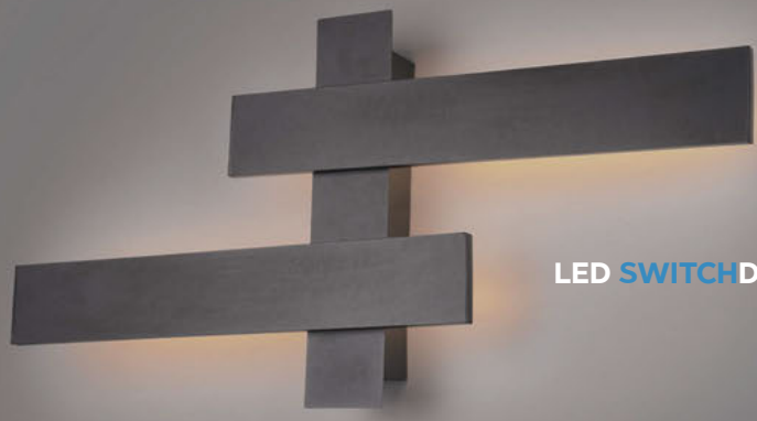
LED SWITCH DIMMER